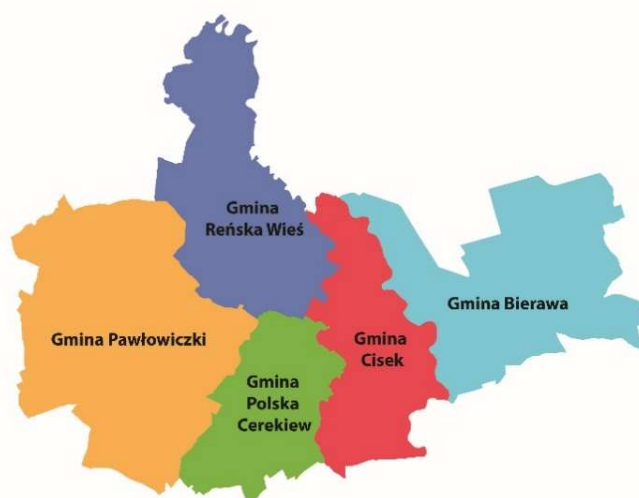
Rysunek 1. Mapa obszaru LGD Stowarzyszenie „Euro-Country”.